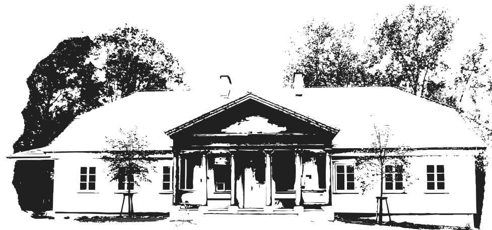
Dwór w Krasnogrudzie, Międzynarodowe Centrum Dialogu

20.00 wyjazd do Białegostoku (powrót ok. 22.30)