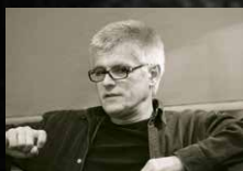
SCENARIUSZ I REŻYSERIA: PIOTR TOMASZUK

Wacław Niżyński (ur. 12 marca 1889 w Kijowie, zm. 8 kwietnia 1950 w Londynie) – rosyjski tancerz i choreograf polskiego pochodzenia, jeden z najwybitniejszych tancerzy baletu XX w. W wieku 30 lat, będąc na szczycie światowej kariery, Niżyński zaczął przejawiać objawy schizofrenii. Choroba wyeliminowała go ze świata baletu, uniemożliwiła reżyserowanie i skazała na pobyt w szpitalach psychiatrycznych przez ponad połowę życia. Genialny tancerz pozostawił fascynujący dokument choroby w postaci dzienników.